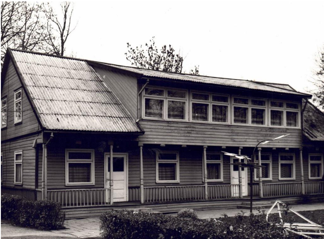
(1978 m. kolūkis atidavė naujai suremontuotą pastatą, kuriame įsikūrė darželio grupė.)