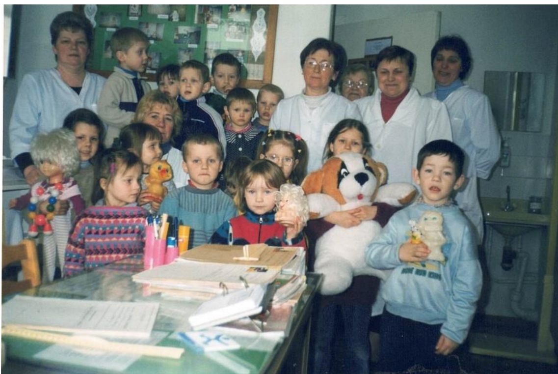
(Vaikai apsilankė Mosėdžio PSC.)

2003 – 2004 m. m. pradžioje funkcionuoja 3 grupės: jaunesnio mišraus amžiaus grupė su 14 vaikų, iš jų 6 lopšelinio amžiaus, vyresnio mišraus amžiaus – 14 vaikų ir popietinė grupė su 5 vaikais. Iš viso dirba 10 darbuotojų, iš jų 5 pedagogai.