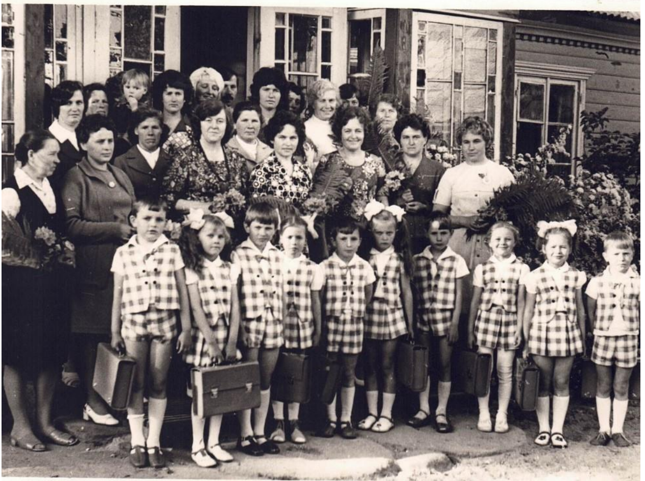
(Būrelis vaikų ir darbuotojų išleistuvių į mokyklą dieną.)