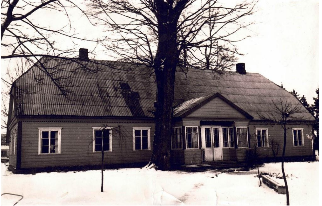
(Pastatas, kuriame 1960m. rugsėjo 16d. Pradėjo veikti darželio grupė)

Mosėdžio vaikų lopšelis-darželis įkurtas 1960 m. rugsėjo 16 d. klebonijos patalpose. Pirmoji darželio vedėja L.Švitinienė subūrė 4 darbuotojų kolektyvą, kuris dirbo su 14 vaikučių.