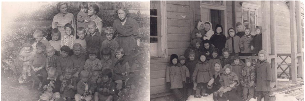
(Pirmasis vaikučių ir darbuotojų kolektyvas)